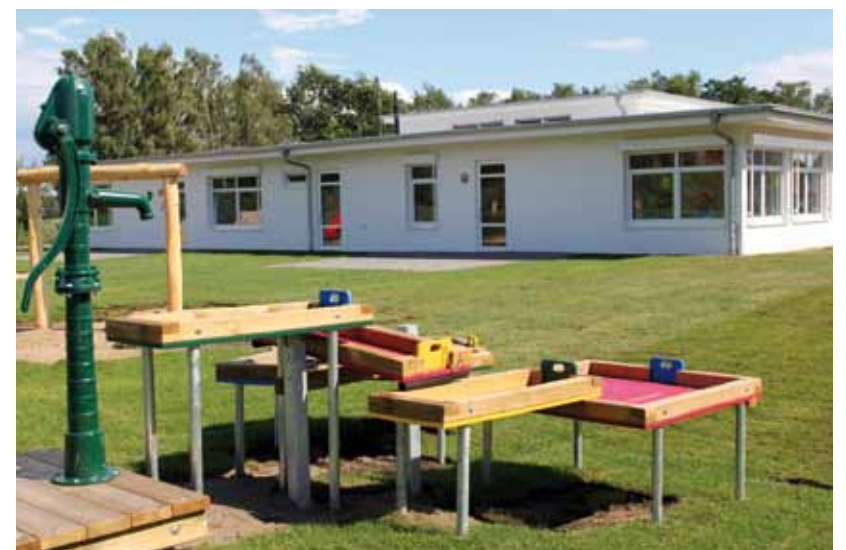
Kita Robin HuD

Die Hönigsberg & Düvel Datentechnik GmbH ist ein akkreditiertes ITIL®-Lehrinstitut.